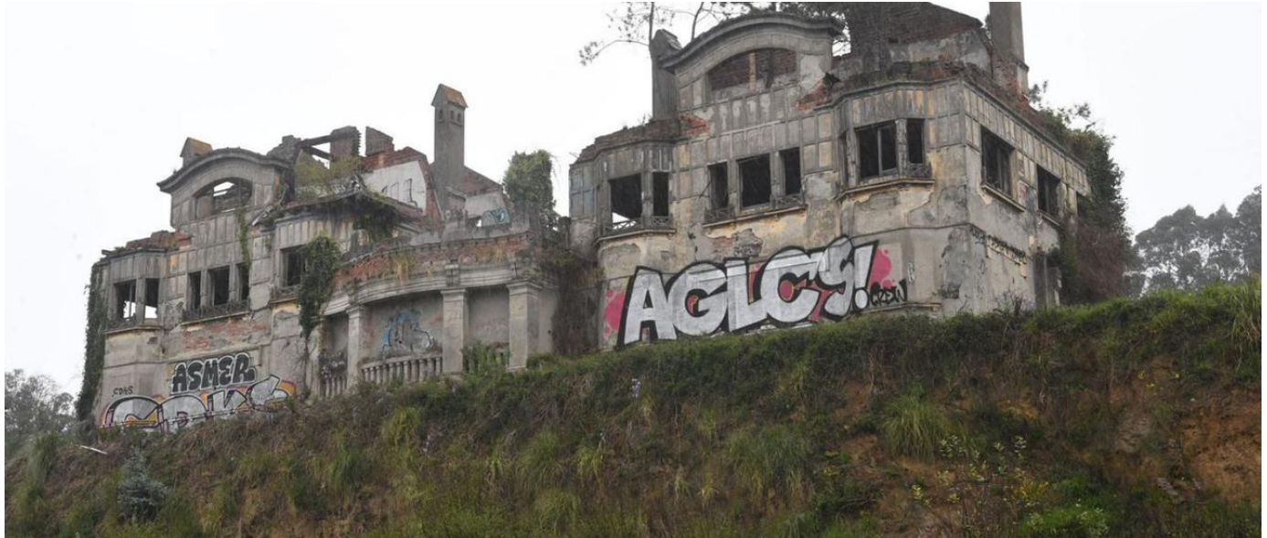
Vista de las casas Bailly, el pasado mes de marzo.