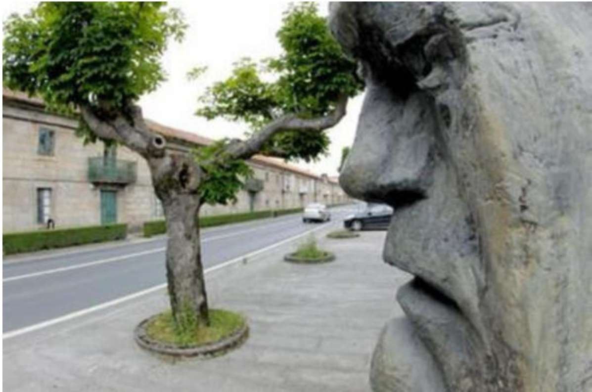
Sede da Fundación Camilo José Cela en Iria Flavia