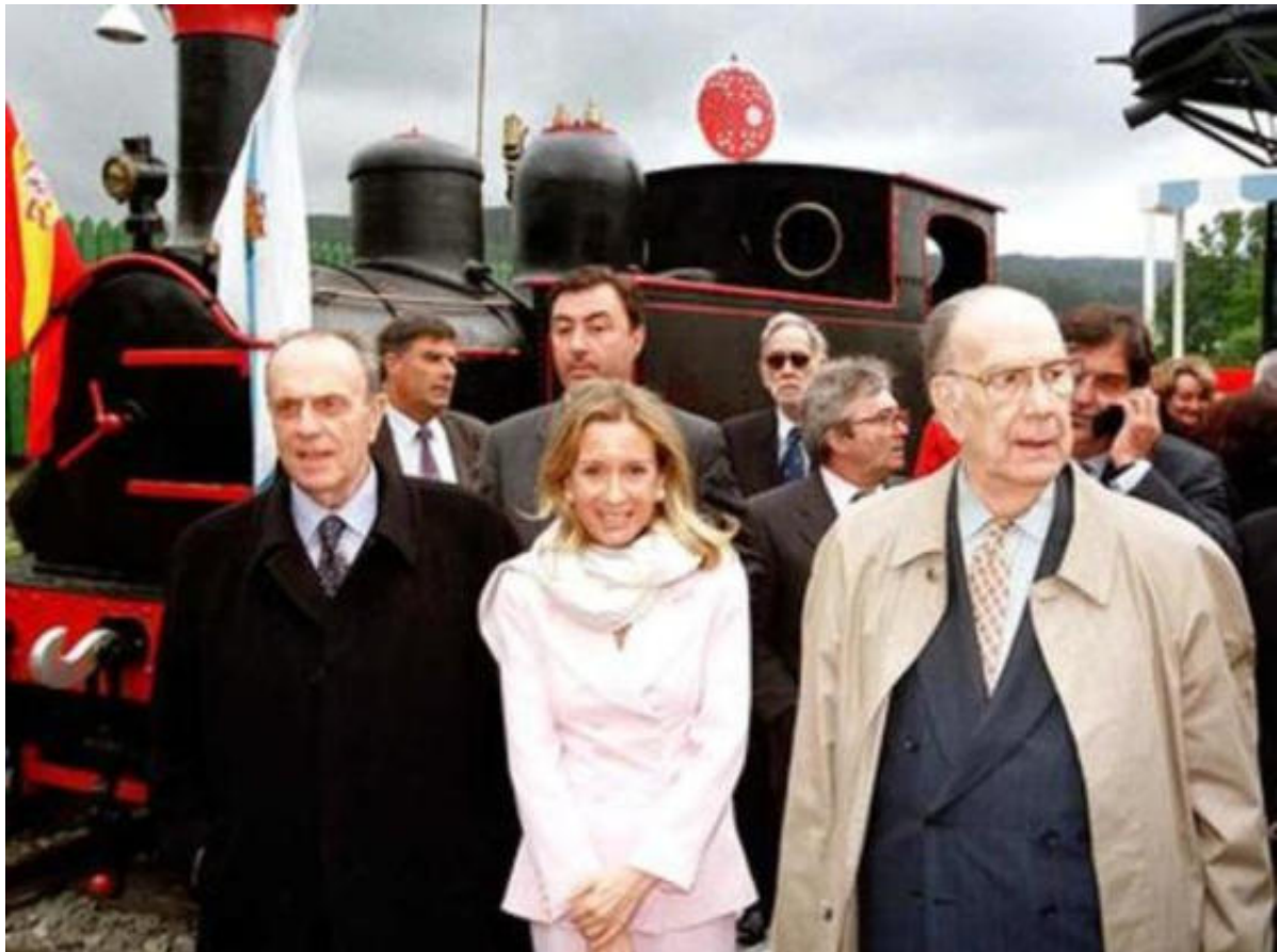
Camilo José Cela e Manuel Fraga na inauguración da fundación

O Goberno Galego sinala que “ante a posibilidade de que a venda dos fondos da Fundación puidese derivar cara a mans privadas, a Comunidade Autónoma estableceu o procedemento de adquisición de fondos de interese para centros artísticos e museísticos de xestión autonómica”.