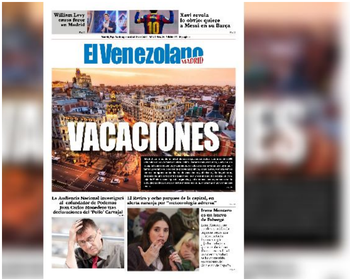
ario El Venezolano. Madrid, del 03 al 16 de agosto de 2022