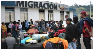
Entran en vigencia más medidas para reducir el flujo de venezolanos en Sudamérica