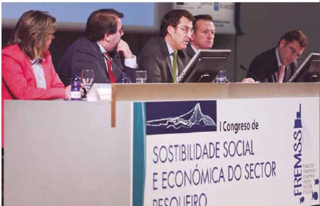
Alberto Núñez Feijóo inaugura el Congreso.

http://www.fremss.org/quienes-somos/organigrama